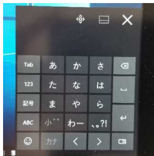
携帯・スマホタイプ